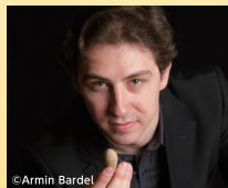
指揮 口ッセン・ゲルゴフ